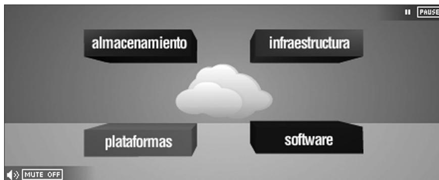
Gráfico 2. Oferta de servicios Cloud de IBM

Al evitar el gasto inicial de capital en sistemas complejos de infraestructura tecnológica, las empresas pueden ahorrar dinero y redireccionar estos recursos en potenciar otras áreas. La infraestructura informática se convierte ahora únicamente en un gasto de operación, ya que no hay hardware para comprar, administrar o hacer mantenimiento. El modelo Cloud también puede ayudar a las empresas a evitar el retorno de la inversión de riesgo y la incertidumbre, la posibilidad de cambio de proveedor si el servicio no funciona correctamente; evitar la pesadilla del fracaso costoso de activo fijo de seis meses en línea. Cloud Computing ofrece la eficiencia y la utilización de los recursos sobre la base de un pay-as-you-go (paga conforme utilices), modelo para una mejor escalabilidad. Las empresas pueden asignar fondos a los servicios —más o menos— en función de la cantidad que realmente necesitan, de crecimiento o