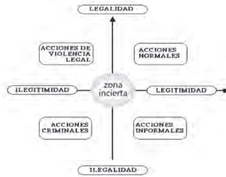
GRAFICO No1 Categorización de las acciones