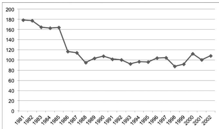
Gráfico 3 Índice de los Términos de Intercambio Año Base 1992=100 Periodo 1980 -2002

Fuente: BCE. Índice de los Términos de Intercambio. Nota Metodológica. Elaboración: El autor